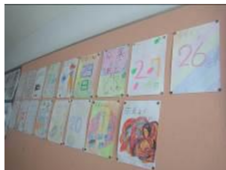
カウントダウン掲示やっています。

いよいよ3月がやってきます。6年間のすべてにおいてのまとめの月となります。卒業に浮かれることなく、一日一日をしっかりと過ごし、気持ちのよい小学校生活の終わり方を考えさせています。引き続き3月もご協力をお願いします。